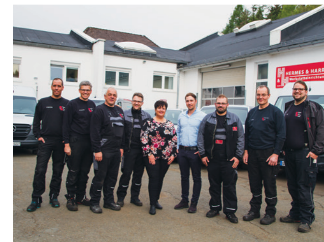
Mit kompetenten Mitarbeitern ist Hermes & Harrer Ansprechpartner für professionelle Hebe- und Prüftechnik und zuverlässigen Service.